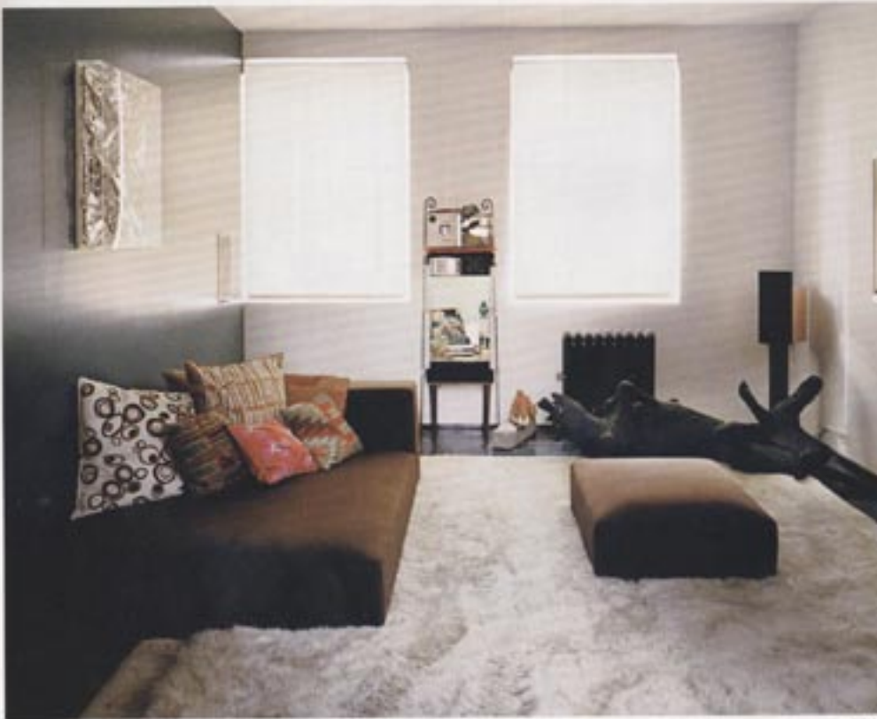
Nella pagina a sinistra: una stanza della galleria ospita un'installazione di Bob Graham. In questa pagina: la media room, camera dove leggere e ascoltare musica. In due finestre, al centro un'opera di Julie Beckler; sul pavimento, a destra scultura di Linsey Barr; appesa alla parete, sopra il divano (MDF Italia), un'opera di Anselm Kiefer.